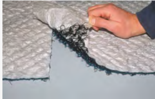
Düşük rulo ağırlığı (sol), yeterli bindirme (sağ)