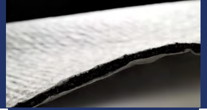
TenCate Polyfelt® Megadrain

TenCate Polyfelt® Megadrain , üç boyutlu polipropilen monofilamentlerin tek veya çift taraflı filtreleme geotekstilleriyle birleştirilmesi ile elde edilmiş drenaj ürünleridir. Oldukça fazla gözenek oranı Megadrain'e yüksek düzlemsel debi kapasitesi sağlamaktadır. Megadrain drenaj matları yüzeysel drenaj için kullanılan geleneksel çakıl tabakasının yerine kullanılır.