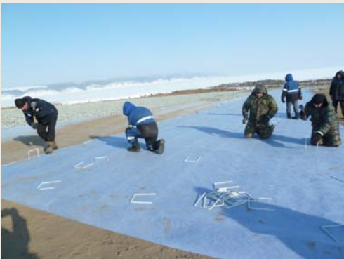
Фиксация TenCate Polyfelt® F70 с помощью фиксирующих скоб