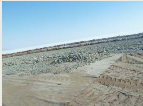
Укладка слоя дробленой породы на TenCate Polyfelt® F70

Для получения подробной информации свяжитесь с: TenCate Geosynthetics Austria Schachermayerstr. 18 A-4021 Linz Tel. + 43 732 6983 0; Fax + 43 732 6983 5353 Email: service.ru@tencate.com