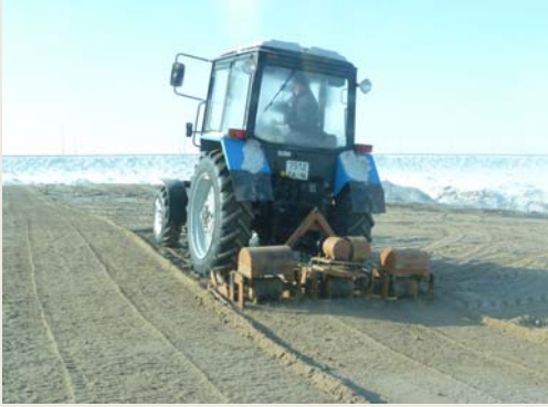
Выравнивание песчанного слоя для укладки TenCate Polyfelt® F70