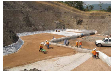
Gambar 2: Tampak atas dari lapisan dasar

Sebelum menggelar geotekstil perkuatan Polyfelt® PEC, rangka kerja dengan kepadatan baik telah disiapkan, kemudian geotekstil kuat tarik tinggi Polyfelt® PEC digelar dengan bagian benang menghadap ke bawah. Penegangan awal geotekstil kuat tarik tinggi Polyfelt® PEC dilakukan dengan menempatkannya pada parit kedalaman 200mm x lebar 300m dan ditimbun. Penyambungan geotekstil kuat tarik tinggi Polyfelt® PEC dilakukan dengan menjahit atau saling tindih 300mm. Material timbunan dipadatkan dengan compactor 10 ton untuk mencapai 90% kepadatan standar proctor . Tamping compactor digunakan untuk memadamkan bagian ujung kotak berongong. Spasi jarak vertikal dari tiap lapisan geotekstil kuat tarik tinggi Polyfelt® PEC adalah 0.5 m. Pemasangan telah berhasil dilaksanakan dalam jangka waktu dan biaya sesuai anggaran.