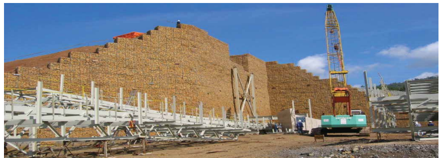
Gambar 4: Contoh tipikal dinding yang diperkuat Polyfelt® PEC yang sudah selesai

Polyfelt® adalah merek terdaftar Royal TenCate.