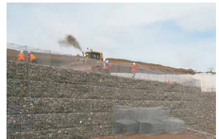
Gambar 3: Pekerjaan konstruksi dinding