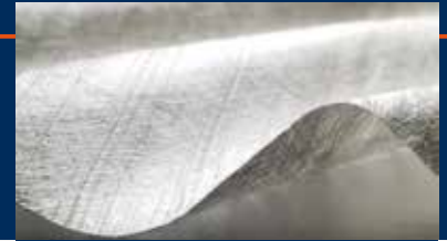
TenCate Polyfelt® TS

TenCate Polyfelt® TS Geotextilien sind mechanisch verfestigte Endlosfaservliesstoffe (Filamentvliesstoffe) aus UV-stabilisiertem Polypropylen. Sie werden seit mehreren Jahrzehnten für eine Vielzahl von Anwendungen im Tiefbau als Trenn- und Filterschicht eingesetzt.