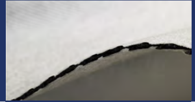
TenCate Polyfelt® DC